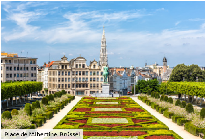
Place de l'Albertine, Brüssel

Die An- und Ablegezeiten sind Richtzeiten. Änderungen der Reiseverläufe und Ausflugsprogramme bleiben vorbehalten. Wenn wegen Niedrig-/Hochwasser oder Schiffsdefekt eine Strecke nicht befahren werden kann, behält sich die Reederei das Recht vor, die Gäste auf dieser Strecke mit Bussen zu befördern, in Hotels unterzubringen und/oder den Streckenverlauf zu ändern. Unter Umständen ist der Umstieg auf ein anderes Schiff nötig.