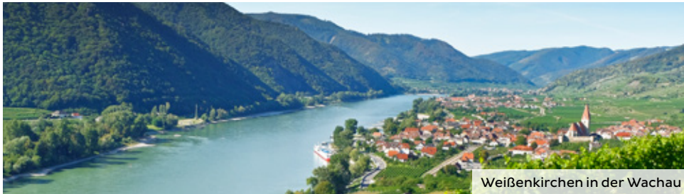
Weißkirchen in der Wachau