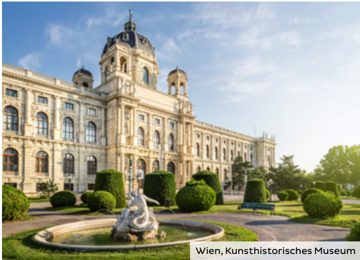
Wien, Kunsthistorisches Museum

Die An- und Ablegezeiten sind Richtzeiten. Änderungen der Reiseverläufe und Ausflugsprogramme bleiben vorbehalten. Wenn wegen Niedrig-/Hochwasser oder Schiffsdefekt eine Strecke nicht befahren werden kann, behält sich die Reederei das Recht vor, die Gäste auf dieser Strecke mit Bussen zu befördern, in Hotels unterzubringen und/oder den Streckenverlauf zu ändern. Unter Umständen ist der Umstieg auf ein anderes Schiff nötig.