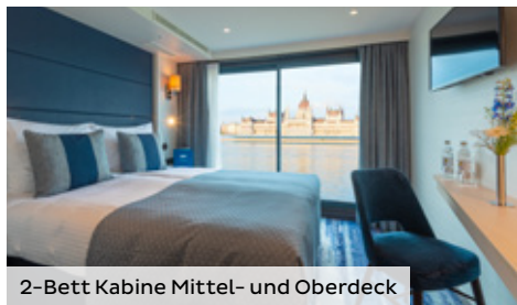
2-Bett Kabine Mittel- und Oberdeck