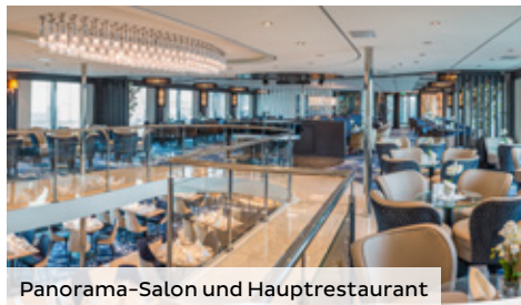
Panorama-Salon und Hauptrestaurant