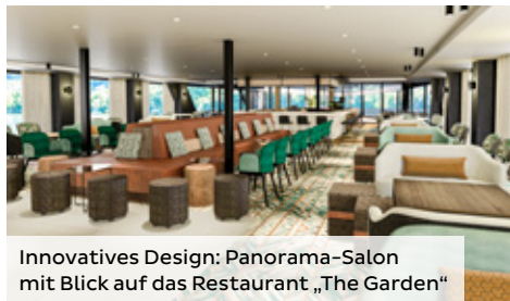
Innovatives Design: Panorama-Salon mit Blick auf das Restaurant „The Garden“