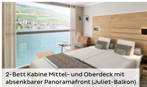
2-Bett Kabine Mittel- und Oberdeck mit absenkbarer Panoramafront (Juliet-Balkon)