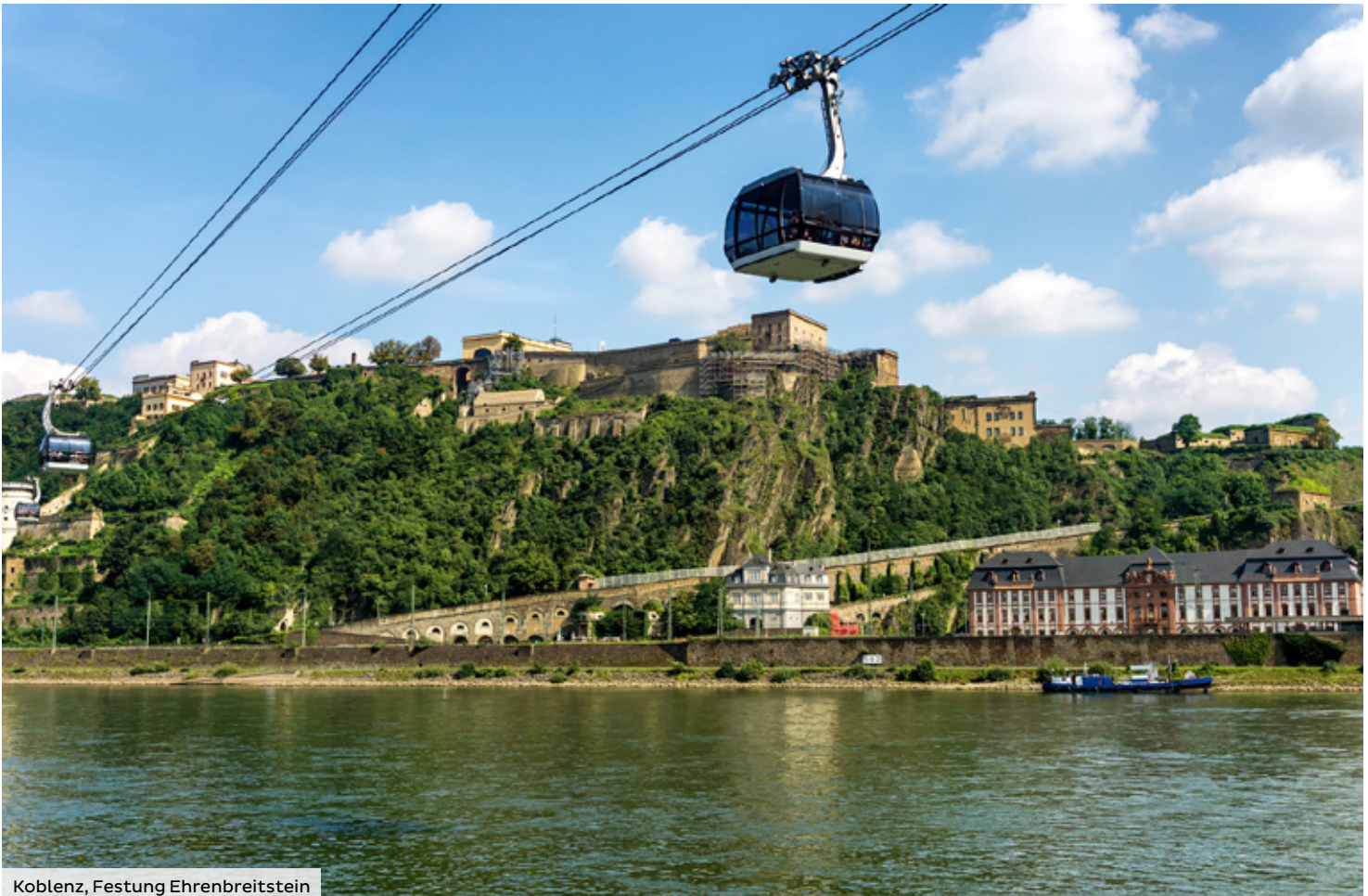
Koblenz, Festung Ehrenbreitstein