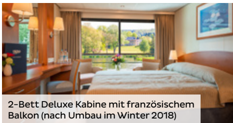
2-Bett Deluxe Kabine mit französischem Balkon (nach Umbau im Winter 2018)